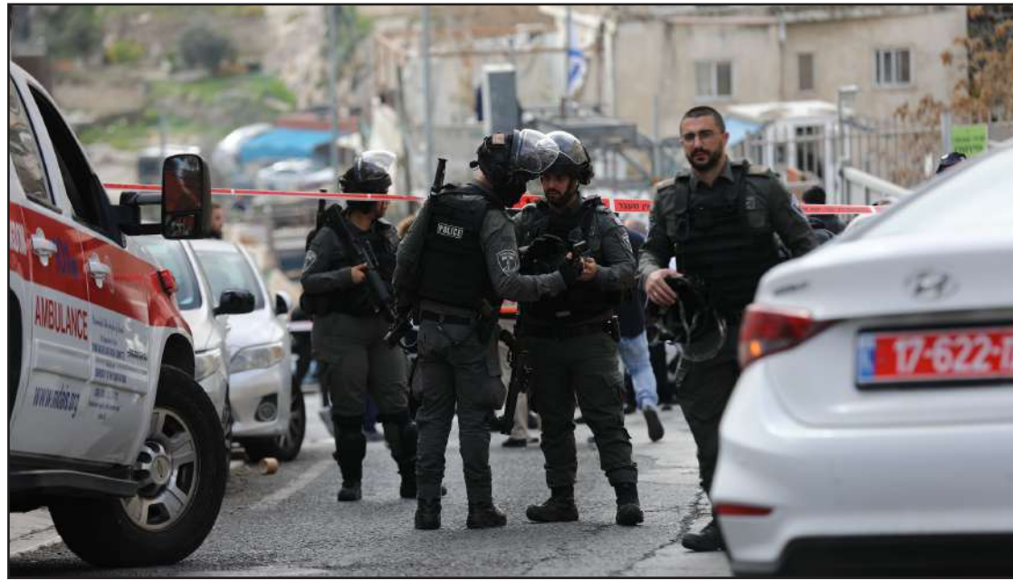
عملية إطلاق نار في بلدة سلوان أسفرت عن إصابة مستوطنين وصفت جراح إحداهما بالخطيرة، أمس

محافظة/ الاستقلال: شهدت مناطق متفرقة من مدينة القدس والضفة الغربية المحتلتين يوم السبت، تصاعداً في عمليات المقاومة والمواجهات مع قوات الاحتلال والمستوطنين، حيث نفذ مقدسي يبلغ من العمر (13 عاماً) 11