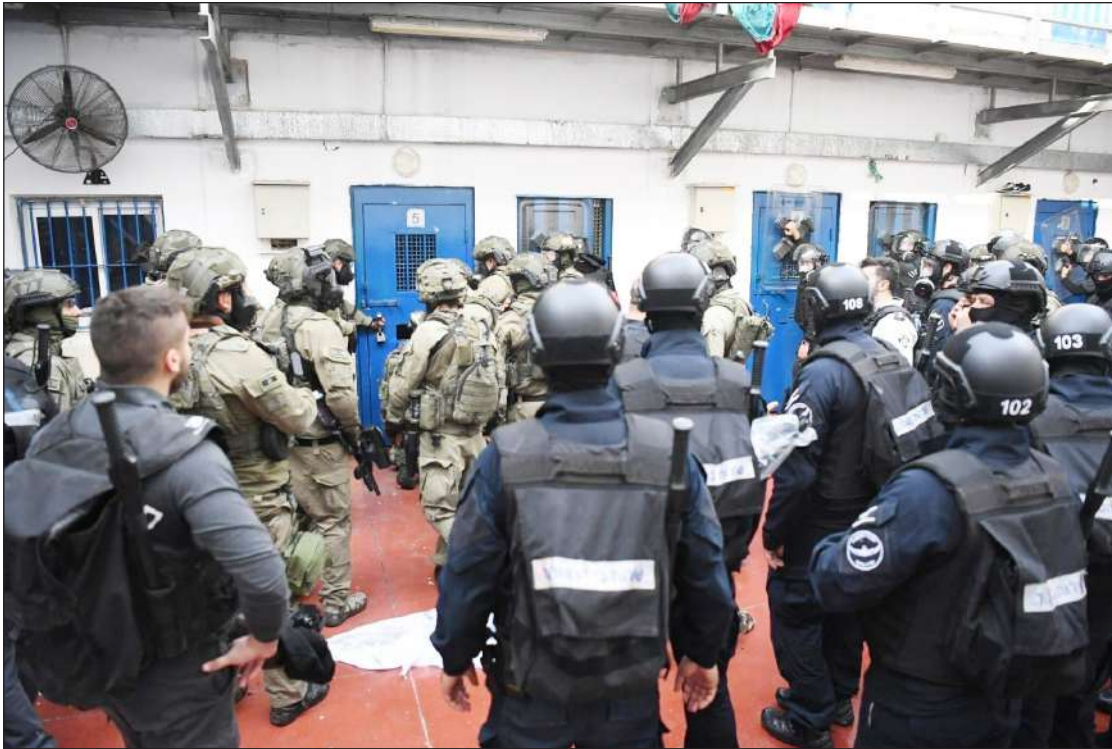
الاحتلال يواصل تصعيده بحق الأسرى داخل سجون الاحتلال