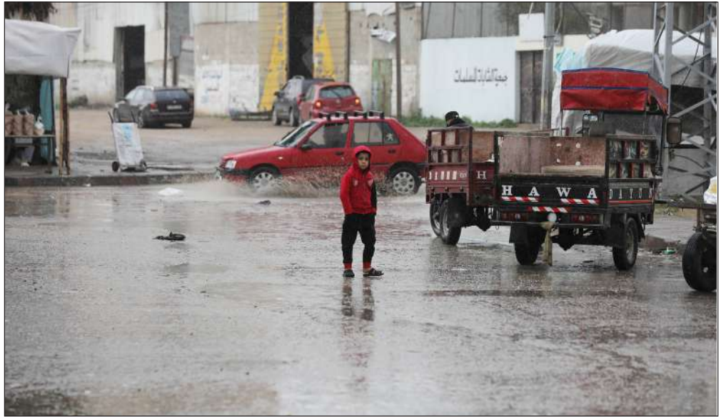
أجواء المنخفض الجوي في مدينة غزة

ومن المتوقع أن يفيد الابتكار الجديد المؤسسات الحكومية كالمستشفيات والمدارس والمطاعم.