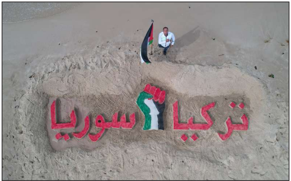
فنان فلسطيني يرسم لوحة على رمال شاطئ بحر غزة تضامناً مع تركيا وسوريا

وتم فيما بعد نقل الرضيع وأمه على وجه السرعة إلى المستشفى لتقديم الرعاية الطبية اللازمة.