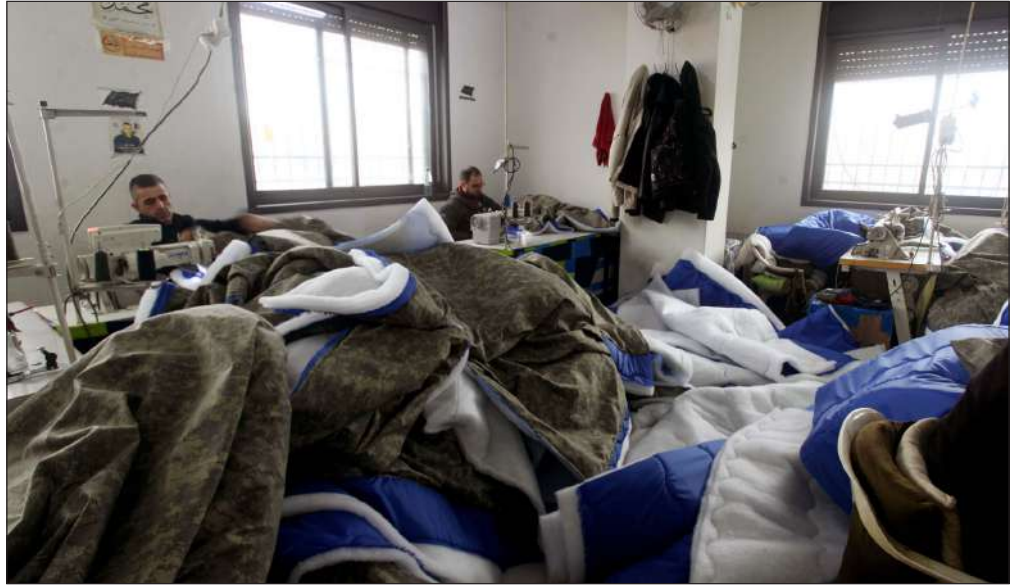
حملة «أغيثوهم» في الخليل تباشر صناعة حقائب نوم لإغاثة المنكوبين في سوريا وتركيا

وأثار النمر الرعب بين أفراد المجتمع حيث أدى إلى تحرك كثير منهم إلى خارج المنطقة، خوفاً من تعرضهم لهجوم قد يؤدي بحياتهم، إلا أن السلطات المحلية الرسمية، تمكنت، بالاستعانة بطواقم عمل متخصصة، من السيطرة على النمر القاتل، حيث أمسكت به في محمية ناغاراهول قبل أن يتسبب في حادث آخر، وبادرت فوراً إلى تخديره وسبل حركته، إذ عرضت صوراً له يظهر فيها مسترخياً بداخل أنبوب أسمنتي طويل.