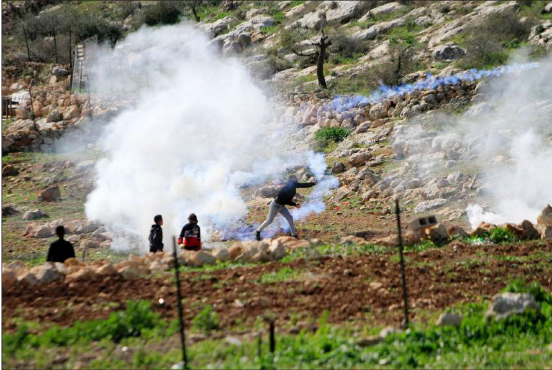
المواجهات بين قوات الاحتلال والشباب في بيت دجن قرب مدينة نابلس أمس

الضفة المحتلة- غزة/ الاستقلال: أصيب عشرات المواطنين الجمعة؛ جراء قمع قوات الاحتلال «الإسرائيلي»، المسيرات الشعبية الأسبوعية في الضفة الغربية المحتلة، كما أصيب