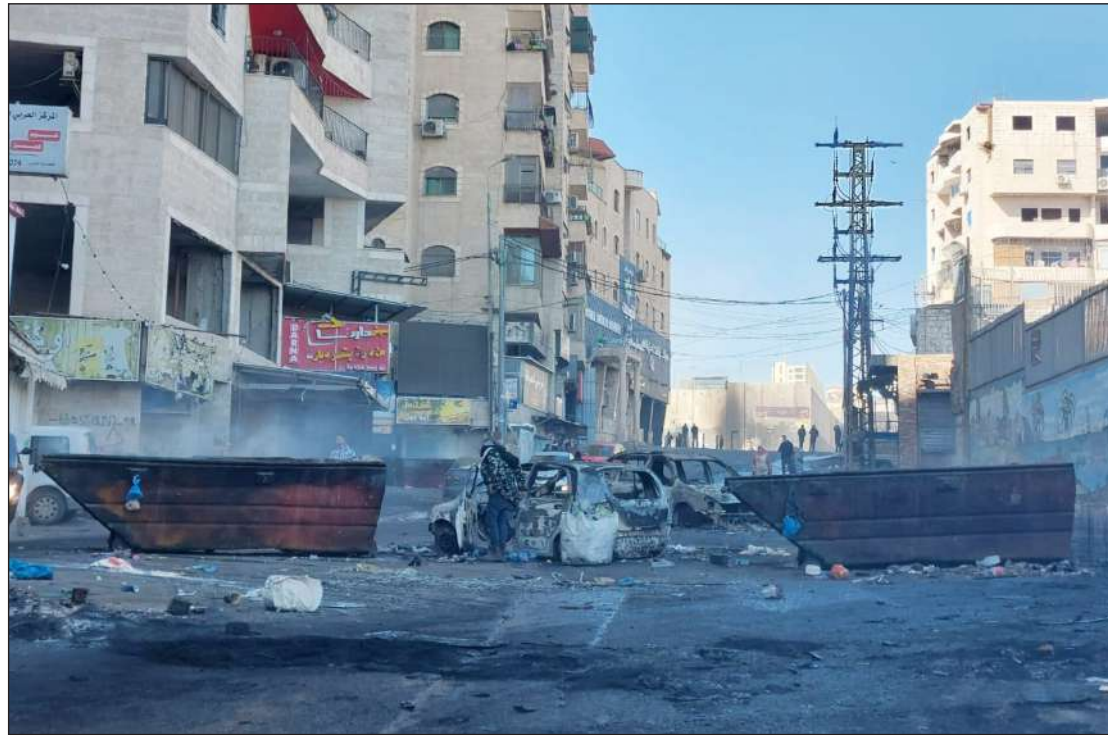
العصيان المدني الذي شهدته مخيم شعفاط بالقدس المحتلة احتجاجاً على سياسات الاحتلال بحق الأهالي

الضفة الغربية- القدس المحتلة/الاستقلال: شهدت أحياء مدينة القدس المحتلة كافة أمس الأحد، عصياناً مدنياً ونفيراً عاماً، إسناداً لأهالي مخيم شعفاط، واحتجاجاً على العقاب الجماعي