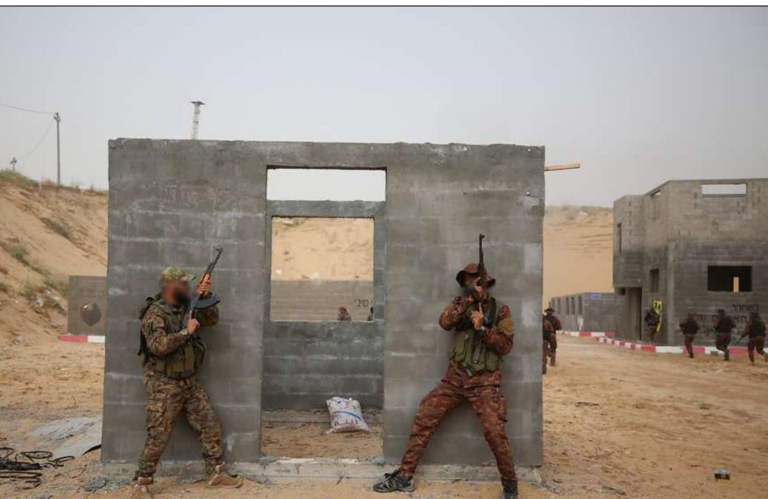
جانب من المناورة العسكرية التي نفذتها سرايا القدس في قطاع غزة أمس