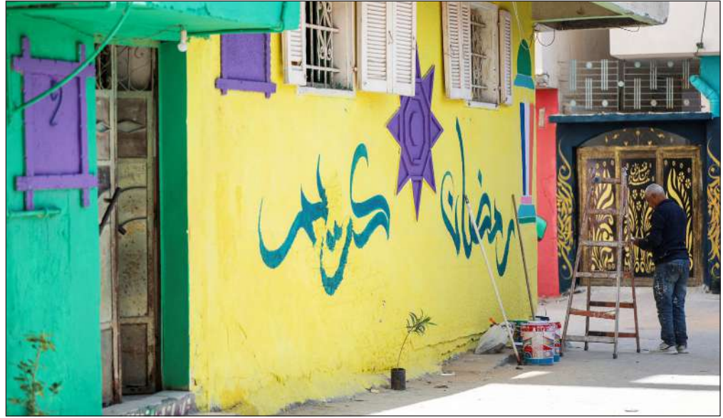
تزيين أحد أزقة مدينة غزة استعداداً لشهر رمضان المبارك

كان ذلك أعنف ثوران له منذ العام 1930 عندما أودى بحياة حوالي 1300 شخص.