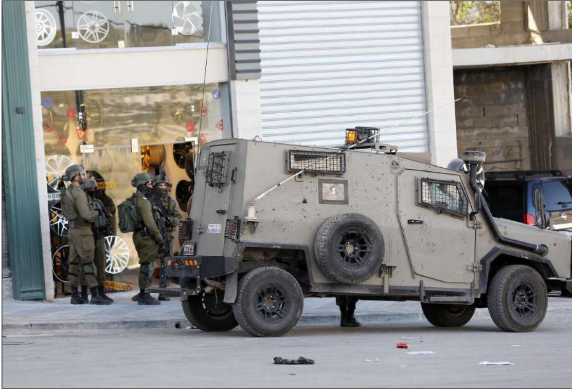
انتشار قوات الاحتلال في مكان استشهاد ثلاثة مقاومين في مدينة نابلس أمس