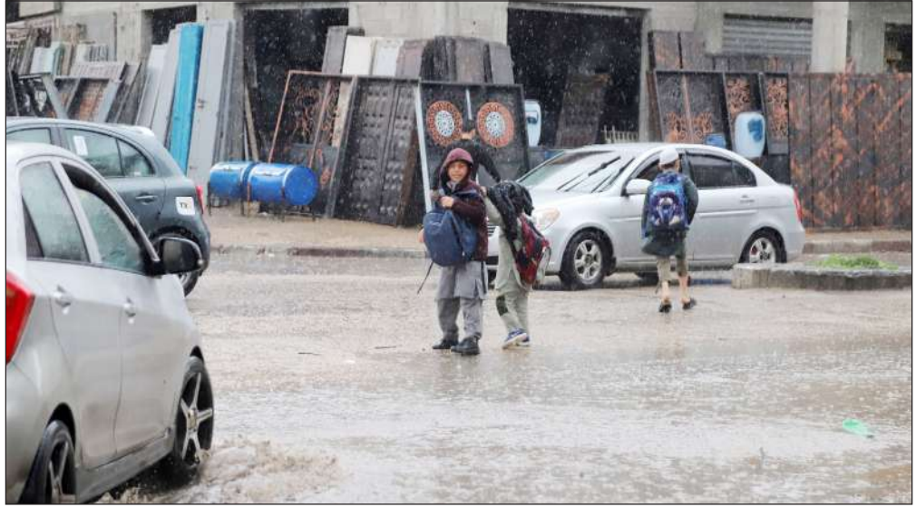
الأجواء الماطرة التي شهدتها مدينة غزة أمس

وكشفت الصحيفة عن أضرار كبيرة شهدها ميدان سباق الـ 7 كيلو بعد اقتلاع عدد كبير من الأعمدة والسياح الحديدي، فيما تضررت نحو 10 عزب لملاك الهجن في الميدان ومركبته.