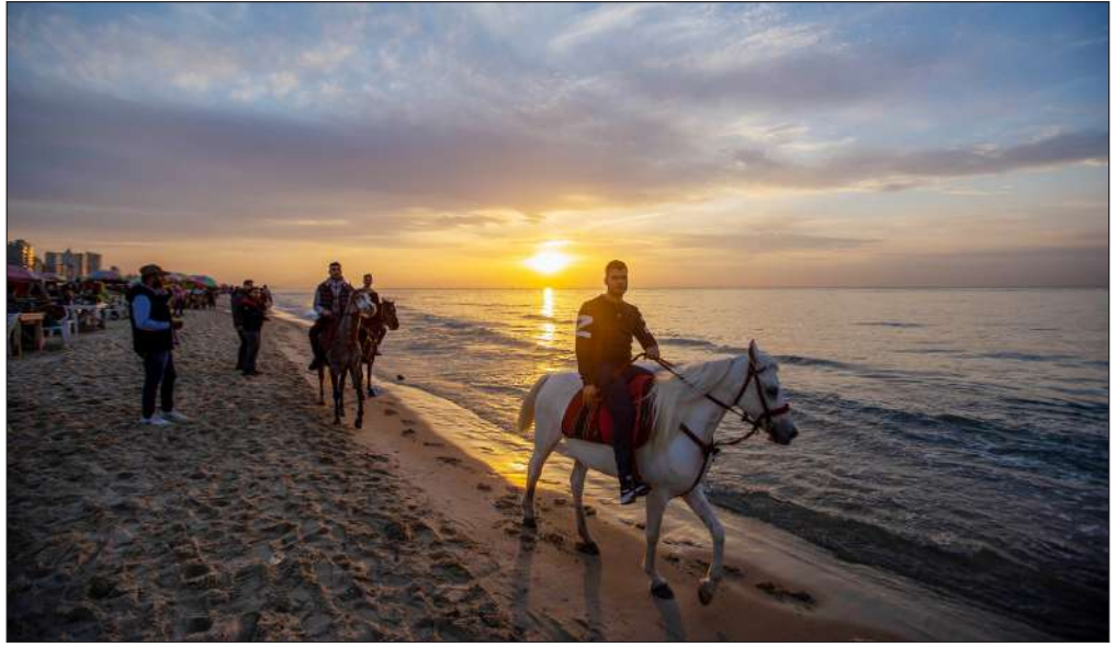
الغروب من شاطئ بحر مدينة غزة أمس