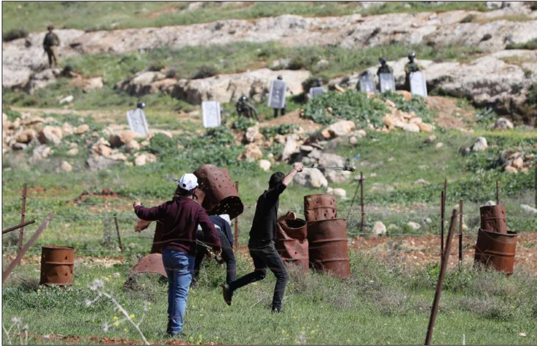
المواجهات بين الشبان وقوات الاحتلال في بيت دجن قرب مدينة نابلس أمس

الضفة الغربية/الاستقلال: استشهد شاب مساء أمس الجمعة، برصاص قوات الاحتلال الإسرائيلي، بزعم محاولته تنفيذ عملية طعن عند المدخل الشمالي لمدينة البيرة، فيما