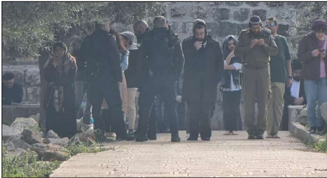
مستوطنون يقتحمون المسجد الأقصى صباح أمس

الضفة الغربية- القدس المحتلة/الاستقلال: أصيب عدد من المواطنين بالرصاص وحالات اختناق، واعتقل آخرون، خلال اقتحام قوات