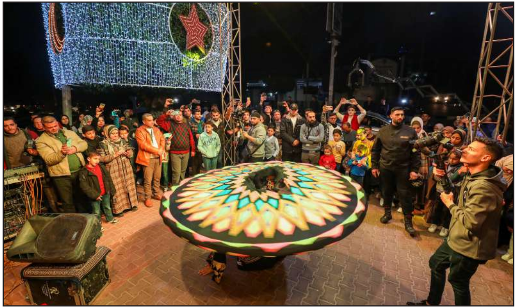
أجواء استقبال شهر رمضان المبارك في مدينة غزة