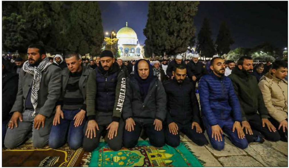
صلاة التراويح في باحات المسجد الأقصى أمس

ويمكن للجهاز نقل البيانات لاسلكياً إلى جهاز كمبيوتر أو هاتف ذكي، لمراجعتها من قبل المريض أو أخصائي طبي.