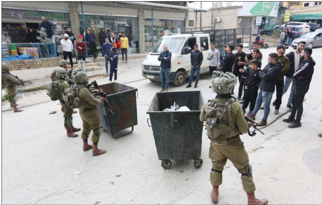
انتشار قوات الاحتلال في بلدة حوارة جنوب نابلس