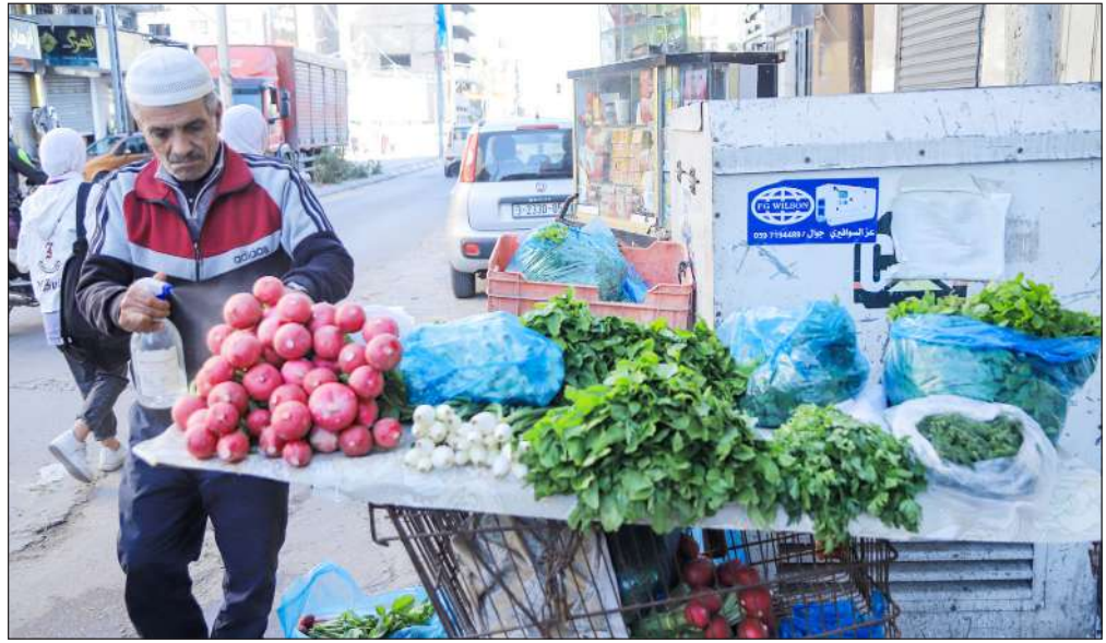
مواطن يبيع الخضراوات بأحد شوارع مدينة غزة

وتمكن «تشات جي بي تي-4» من الحصول على علامة 90% في عدد كبير من الاختبارات، بما في ذلك امتحان المحامين الأمريكي. والروبوت الآلي قادر أيضاً على كتابة مقالات شبيهة بالبشر حول أي موضوع في ثوان استجابة لطلب نصي بسيط من الطالب. وتعمل حالياً شركة «أوبن إيه آي» على أداة لاكتشاف المحتوى المكتوب بالذكاء الاصطناعي، لكنها تحذر من أنه ليس دقيقاً بنسبة 100%.