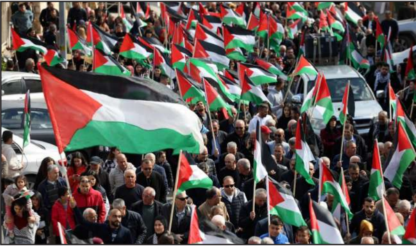
مسيرة لإحياء ذكرى يوم الأرض في سخنين بالداخل المحتل