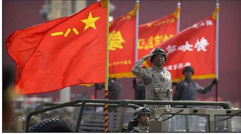
كما أوضح المتحدث باسم الوزارة أن «التدريبات الثلاث أرسلت قوات من بينها 12 سفينة ووحدات البحرية بين الدول الثلاث عززت الصداقة والتعاون

عمليات خاصة ووحدات غوص للمشاركة في التدريبات، وكانت وزارة الدفاع الروسية أعلنت في 15 آذار انطلاق التدريبات البحرية الثلاثية «حزام الأمن البحري 2023»، في مياه بحر العرب بالقرب من ميناء تشابهار بإيران، بمشاركة البحرية الروسية، وبحرية جيش التحرير الشعبي الصيني، والقوات البحرية لجمهورية إيران الإسلامية. وهذه هي التدريبات البحرية الثانية التي تجريها روسيا والصين حتى الآن هذا العام، حيث تسعى موسكو إلى تعزيز العلاقات مع بكين وطهران. ووقعت في فبراير/شباط الماضي قبالة سواحل جنوب إفريقيا واشتركت فيها البحرية الجنوب إفريقية. وتأتي التدريبات وسط توترات متصاعدة بين الولايات المتحدة والصين بشأن مجموعة من القضايا، بما في ذلك رفض الصين انتقاد موسكو بسبب غزوها لأوكرانيا، ومواصلة دعمها للاقتصاد الروسي.