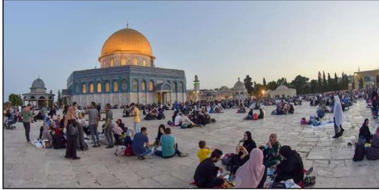
المسجد الأقصى، لصلاة فجر الثامن من شهر رمضان المبارك. ويترقب المسجد الأقصى المبارك عدواناً كبيراً واقتحامات واسعة خلال ما يسمى «عيد الفصح»

ويمثل قرار الجماعات الاستيطانية خطوة عدوانية جديدة بحق المقدسات الإسلامية، ومحاولة لذبج القرايبن المزمعومة داخل المسجد الأقصى المبارك.