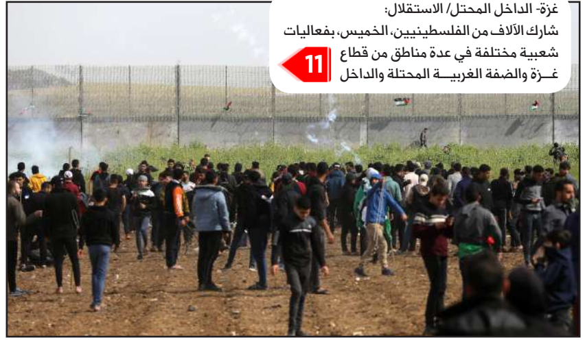
وقفة شرق مدينة غزة لإحياء ذكرى يوم الأرض