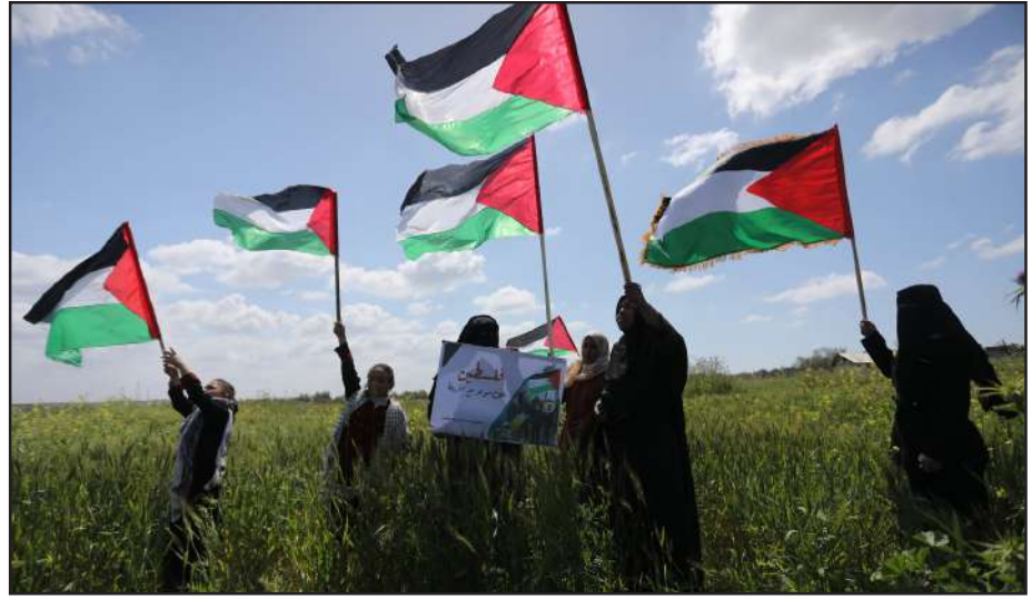
مواطنون يشاركون في فعاليات إحياء ذكرى يوم الأرض شرق مدينة غزة