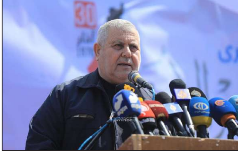
وأشار إلى أن ذكرى يوم الأرض تجل هذا العام في ذروة الهجمة الإسرائيلية الشرسة بحق شعبنا وارضنا وقال القيادي البطش: «إن إمعان الاحتلال في غيه من خلال الملاحقة والهدم والتهدية».

كما وجه البطش، التحية للمقاومة في الضفة الباسلة الكتائب والألوية وعربن الأسود وكل القابضات التي تقاوم الاحتلال، كما حيا أسرانا الإبطال وفي مقدمتهم الشيخ خضر عدنان الذي يخوض إضراباً عن الطعام.