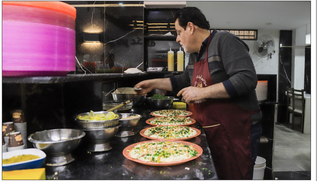
تجهيز فتة الحمص داخل أحد مطاعم غزة

ويعتقد أن جنس «هوراكان» ظهر خلال فترة أواخر العصر الميوسيني، التي يرجع تاريخها إلى ما يتراوح بين 11,6 و5,3 ملايين سنة، واكتشفت أقدم حفريات لأنواع هذا الجنس في حوض لينشيا بمقاطعة قانسو الصينية، وفقاً لدراسة نشرت مؤخراً في مجلة (المتحف الأمريكي للمبتدئين). وكانت الأنواع الأكلة للحوم في عصور ما قبل التاريخ منتشرة في أوروبا وأمريكا الشمالية.