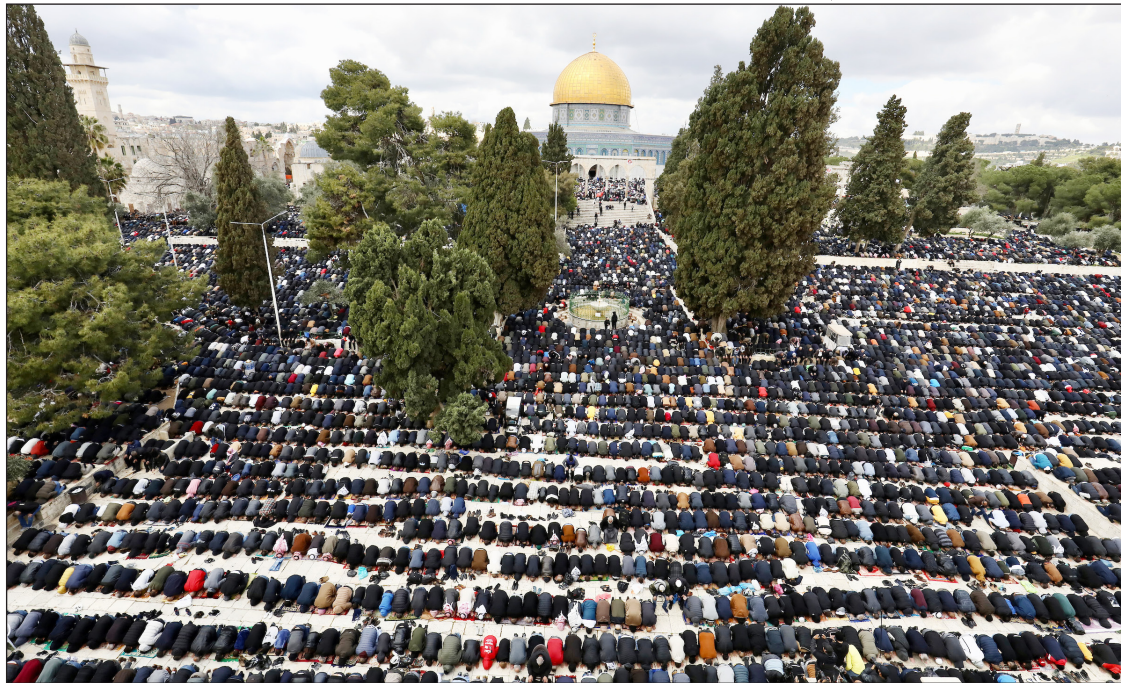
صلاة الجمعة في باحات المسجد الأقصى أمس

مدينة القدس منذ ساعات صباح الجمعة حتى قبل صلاة الظهر، وشهدت الحواجز العسكرية ازدحاماً كبيراً من المصلين الوافدين إلى مدينة