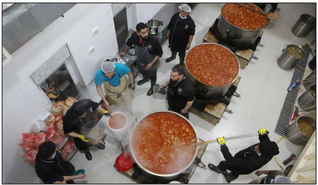
فلسطينيون يعدون وجبات الطعام في التكية الإبراهيمية في الخليل لتوزيعها مجاناً على الأسر المتحفظة

شهد عدد سكان مصر 2023، الخميس الماضي، زيادة جديدة كبيرة، إذ وصل عدد سكان مصر بالداخل إلى 104 ملايين و750 ألف نسمة، بزيادة قدرها 750 ألف نسمة خلال 180 يوماً، وفقاً للساعة السكانية الموجودة أعلى مبنى الجهاز المركزي للتعبئة العامة والإحصاء. وكان عدد سكان مصر 2023 سجل 104 ملايين نسمة بالداخل في الأول من أكتوبر من العام الماضي، أي أن مقدار الزيادة في عدد سكان مصر التي سجلتها الساعة السكانية بلغ 750 ألف نسمة. كم عدد سكان مصر سنة 2023؟ وفقاً للبيان التعبئة والإحصاء سجلت مصر الربع مليون نسمة الأولى بعد الـ 104 ملايين بالداخل في يوم 26 نوفمبر من العام الماضي، أي خلال 56 يوماً، ليصبح إجمالي عدد سكان مصر 104 ملايين و250 ألف نسمة. ثم زاد عدد سكان مصر ربع مليون نسمة ثانية يوم 24 يناير من العام الجاري أي خلال 59 يوماً. وسجل عدد سكان مصر ربع مليون نسمة ثالثة أمس أي خلال 65 يوماً.