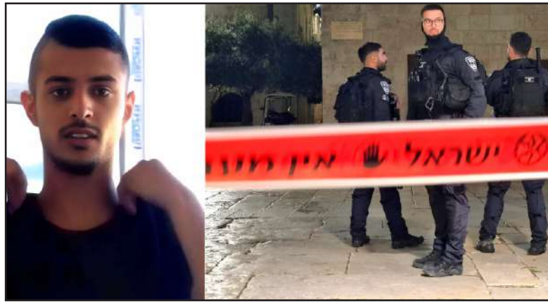
عن الدعوات لإدخال ألف مستوطن لذبج القرايين في الأقصى.