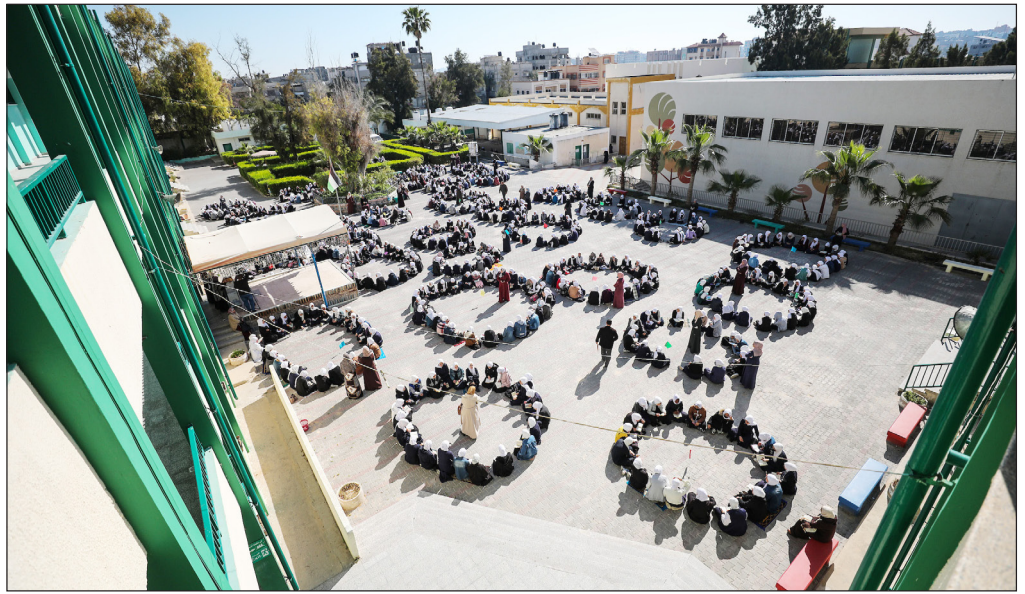
طابلات يحتمن القرآن الكريم في جلسة واحدة داخل مدرستهن في النصيرات وسط قطاع غزة

ذكرت الصحيفة أن ساسون دفعت نحو 13,5 ألف دولار للحصول على الرخصة. لم تتخل المرأة عن هدفها وقالت إنها بحاجة لتعلم القيادة من أجل مشروع بيع الخضار.