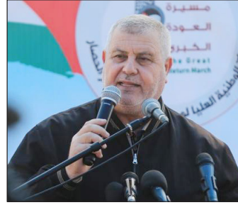
وأعتبر البطش أن ما وصلت إليه القضية الفلسطينية من مخاطر تستدعي من الجميع السعي لتوحيد الصف الوطني على قاعدة حماية