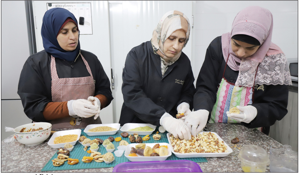
فلسطينيات يحضرن صناديق التمر والفاكهة المجففة والمكسرات في مدينة غزة

توصلت دراسة جديدة إلى أن اختبارا بسيطا قد يساعد في التمييز بين الحقيقة والكذب بدقة تصل إلى 80 في المئة. وفي الدراسة التي أعدها باحثون من جامعة أمستردام فإن علامات منبهة مثل «هل المتحدث يبدو متغيرا أو قلقا أو يتململ أثناء الحديث؟»، يمكن أن تساعد في اصطاد الكذابين. وبحسب البحث، الذي نشر في مجلة «طبيعة السلوك البشري»، فإن الشخص يقول الحقيقة إن قدم تفاصيل غنية «عن لمن وماذا ومتى وكيف ولماذا»، أما إن فكر في هذه التفاصيل كثيرا فمن المحتمل أنه يكذب. ويقول برونو فيرشوير، عالم النفس والمؤلف الرئيسي للدراسة، إن الناس لديهم صور نمطية حول شكل الأبرياء والمذنبين، والتي لا تنبئ كثيرا بقول الحقيقة أو الكذب. وأجرى فيرشوير وزملاؤه في جامعة أمستردام تجربة وطلبوا من المشاركين الـ 1445 في الدراسة تخمينًا حول ما إذا كانت البيانات حول أنشطة بعض الطلاب في الحرم الجامعي حقيقة أم كاذبة. وخلص الباحثون إلى أن المشاركين الذين اعتمدوا على الحدس للكشف عن الأكاذيب، لم يكن أداءهم أفضل من الصدفة العشوائية. لكن الذين تلقوا تعليمات بالتركيز فقط على التفاصيل في البيانات تمكنوا من تمييز الحقيقة من الأكاذيب بدقة تتراوح بين 59 و79 في المئة.