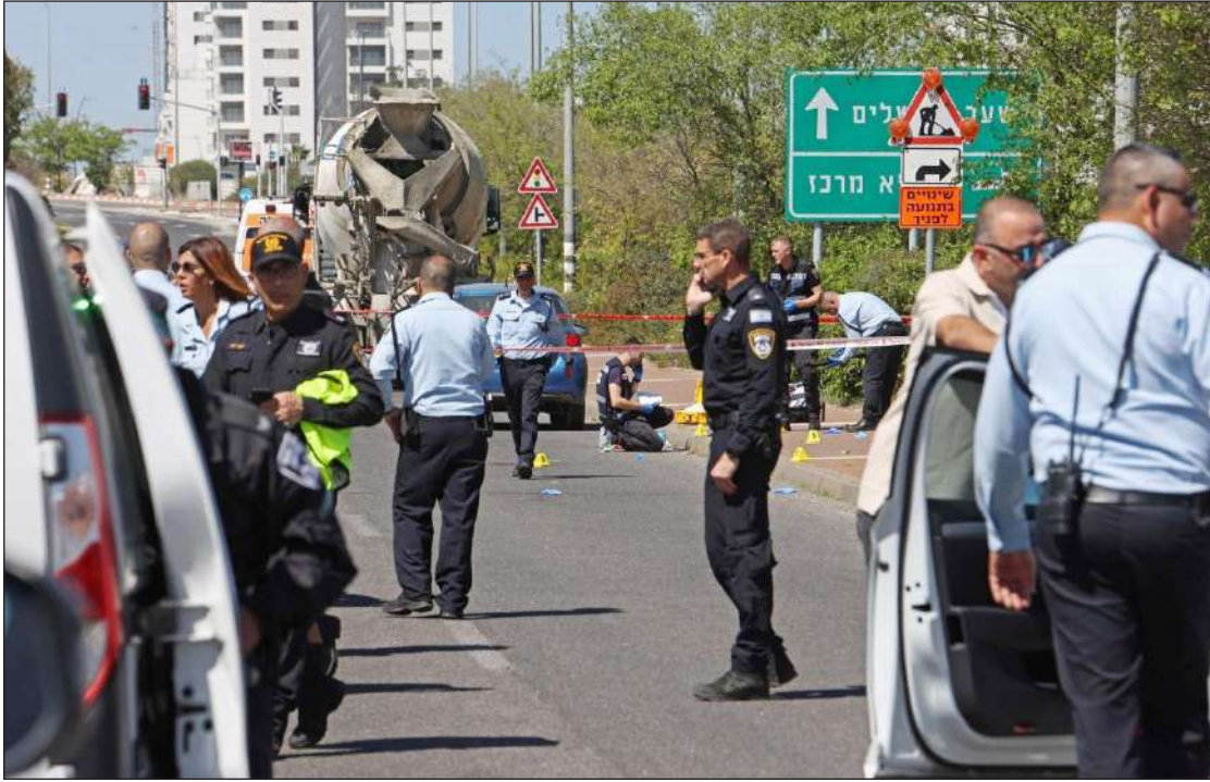
انتشار قوات الاحتلال في مكان عملية «تل أبيب» أمس

الضفة الغربية- القدس المحتلة/ الاستقلال: إصيب جنديان إسرائيليان، أمس الثلاثاء، في عملية طعن فدائية في منطقة «ريشون لتسيون» بـ (تل أبيب) المحتلة، في الوقت ذاته، أصيب عدد من المواطنين خلال مواجهات مع قوات الاحتلال في مناطق من الضفة المحتلة، في حين حولت شرطة الاحتلال الإسرائيلي مدينة القدس المحتلة إلى ثكنة عسكرية، استعداداً لدخول «عيد الفصح» العبري، في المقابل، يستعد المقدسيون للتصدي لأي محاولة إسرائيلية لـ «تقديم وذبح القرابين»، داخل الأقصى، عبر تكثيف الرباط وشهد الرجال للمسجد، من أجل