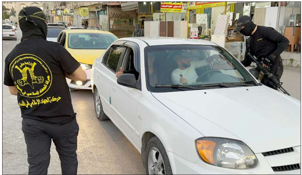
مقاومون من سرايا القدس يوزعون التمر والماء على المواطنين في جنين

وجد علماء أن رسامين مشهورين، مثل ليوناردو دافنشي وساندرو بوتيتشلي، وغيرهما، قد جربوا خلط صفار البيض بالطلاء الزيتي لمساعدة اللوحات على تحمل الرطوبة ومنع التجعد والاصفرار، حسب قناة «روسيا اليوم». وقالت دراسة نشرتها «نيتشر كومنيكيشن»: إن «البحث في عادات الرسم لدى الرسامين الرئيسيين قد يحسن الحفاظ على الأعمال الفنية التي لا تقدر بثمن». وبينما تم اكتشاف بقايا البروتين سابقاً في الروائع، أظهرت الدراسة أن تضمينها البيض كان على الأرجح متعمداً. وفي الدراسة، وجد الخبراء أن إضافة البيض إلى اللوحات الزيتية «يعمل كمضاد للأكسدة، ويبطئ بدء المعالجة». بمعنى آخر، تساعد هذه التركيبة في منع الطلاء من التدهور. وقال معد الدراسة أوفيلي رانكيه، من معهد هندسة العمليات الميكانيكية والميكانيكا في معهد «كارلسروه» للتكنولوجيا في ألمانيا: «تظهر نتائجنا أنه حتى مع وجود كمية صغيرة جداً من صفار البيض، يمكنك تحقيق تغيير مذهل في خصائص الطلاء الزيتي، ما يوضح كيف يمكن أن يكون مفيداً للفنانين». ووجدت الدراسة أن إضافة البيض، ساعدت أيضاً في أثناء تجفيف اللوحات على منع الاصفرار وظهور التجاعيد في اللوحة.