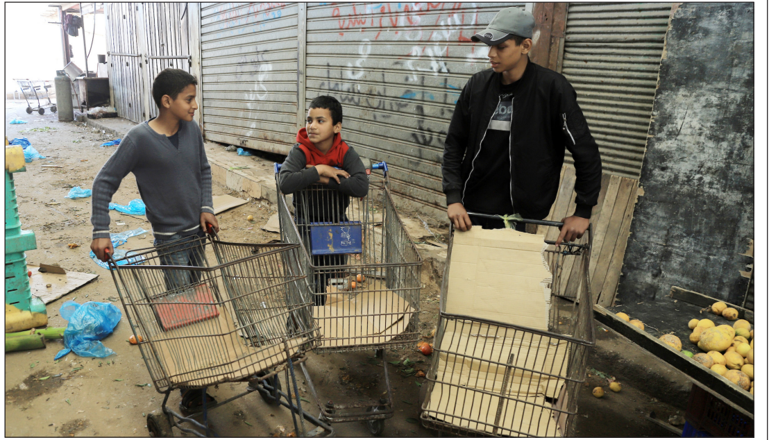
أطفال يعملون في نقل بضائع العملاء أثناء تسوقهم في سوق الزاوية بمدينة غزة