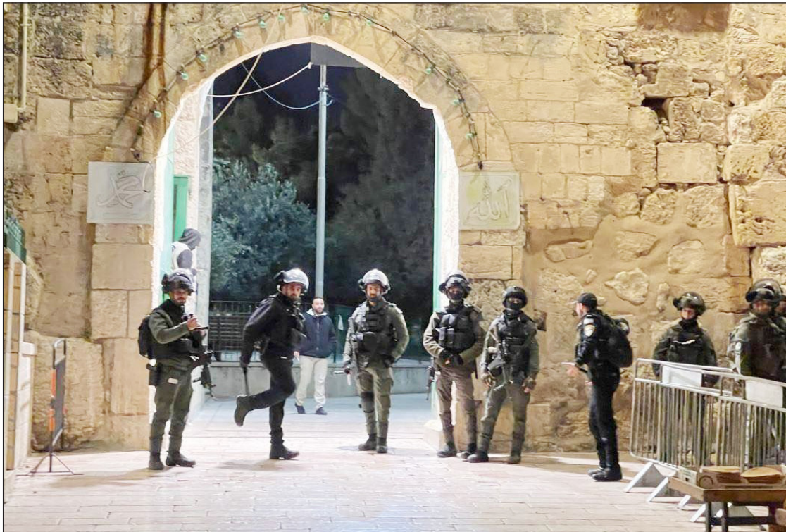
انتشار قوات الاحتلال على أبواب المسجد الأقصى المبارك عقب إفراغه من المعتكفين أمس

القدس المحتلة- الضفة الغربية/الاستقلال: اقتحمت قوات الاحتلال الإسرائيلي، ليلية الثالثة على التوالي، المسجد الأقصى المبارك وحاصرت المصلين القبلي واعتدت على المصلين والمعتكفين فيه بالضرب بالعصي، وأطلقت صوبهم قنابل الغاز السام والرصاص المطاطي لإخراجهم منه بالقوة، ما أدى لإصابة عدد منهم. وأفادت مصادر مقدسية بأن قوات الاحتلال اقتحمت باحات الأقصى 11 مجدداً استعداداً لمنع اعتكاف المصلين في المسجد القبلي.