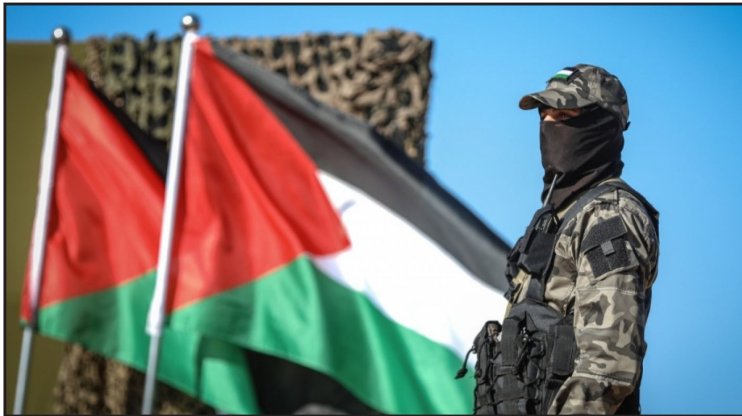
وهدد عدد من قادة الاحتلال السياسييين والأمنييين بالرد على إطلاق الصواريخ بكل قوة، في الوقت الذي ردت فيه المقاومة بأنها لن تقف مكتوفة الأيدي».