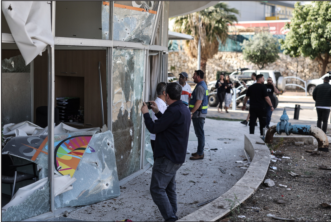
آثار الرشقات الصاروخية التي أطلقت من لبنان اتجاه فلسطين المحتلة، أمس