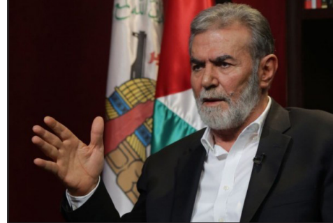
وكان رئيس وزراء الاحتلال بنيامين نتيناهاو، هدد مساء الخميس، بأن حكومته ستجلب ثمنًا باهظًا من

وإذعى أنه لا مصلحة لحكومته في تغيير الوضع الراهن في المسجد الأقصى، قائلاً: «نحن نعمل على تهدئة الأوضاع وسنعمل بحزم ضد المتطرفين الذين يلجأون إلى العنف»، وفق تعبيره.