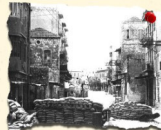
مجزرة حيفا 22/4/1948 100