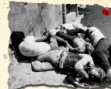
مجزرة دير ياسين 10/4/1948 254