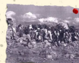
مجزرة الوابصة «الخليل» 29/10/1948 580