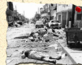
مجزرة صبرا وشاتيلا 18/9/1982 3500