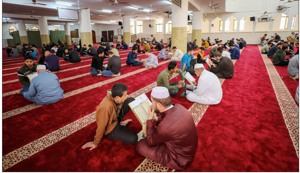
مواطنون يسردون سورة البقرة على جلسة واحدة داخل أحد مساجد شمال قطاع غزة أمس

وقالت السلطات الصينية إن الدجاج الذي قتل (1100 دجاجة) يُقدّر قيمتهم الإجمالية بمبلغ 13,840 يوانا (2015 دولارا).