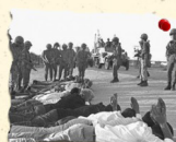
مجزرة خان يونس 12/11/1956 275