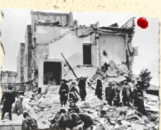
مجزرة القدس 5/6/1967 300