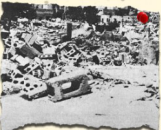
مجزرة اللد 11/7/1948 250