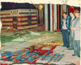
مجزرة الحرم الإبراهيمي 25/2/1994 29