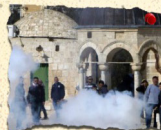
مجزرة المسجد الأقصى 8/10/1990 21