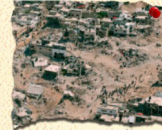
مجزرة مخيم جنين 4/2002 100