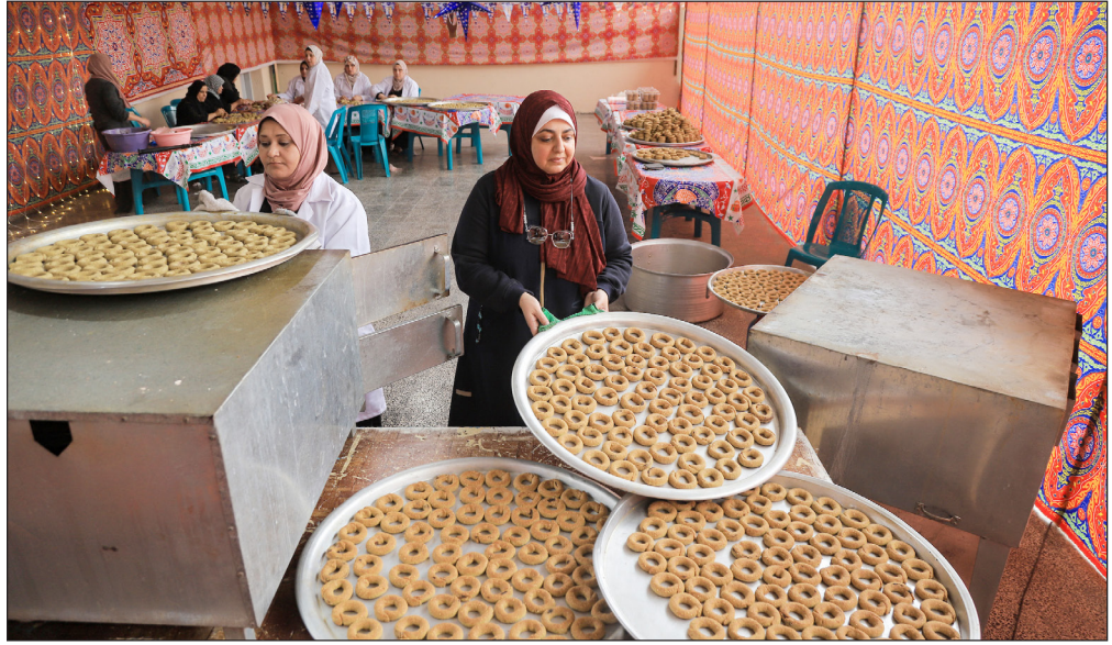
نسوة يجهزون كعك العيد في مدينة غزة

وأشارت نتائج الاكتشاف - التي نشرت في دورية «أيه سي إس نانو» - إلى أنه يمكن إجراء ترقيع الجلد بسهولة عن طريق وصل قطعة جديدة بالقطعة المخدوشة.