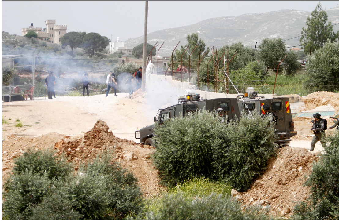
المواجهات بين الشبان وقوات الاحتلال في قرية بيتا جنوب نابلس أمس

بجروح أصيب بها، وإصابة آخرين، خلال اقتحام قوات الاحتلال الإسرائيلي مخيم عقبة جبر جنوب أريحا في الضفة الغربية المحتلة. 11 وكانت قوات كبيرة من جيش