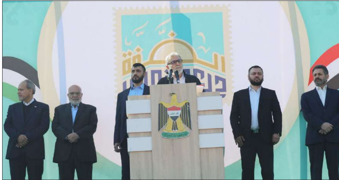
القائد النخالة خلال كلمته في احتفالية بمناسبة يوم القدس العالمي في مدينة بغداد العراقية