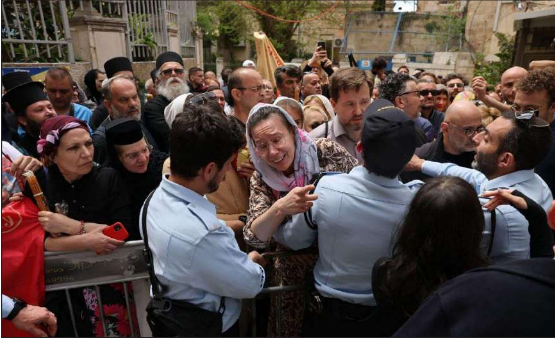
قوات الاحتلال تعتدي على المسيحيين في القدس وتمنعهم من الاحتفال بـ «سبت النور»

الضفة المحتلة/ الاستقلال: أصيب السبت، مواطن من بلدة حلحول شمال الخليل عقب رشق مركبته بالحجارة قرب قرية