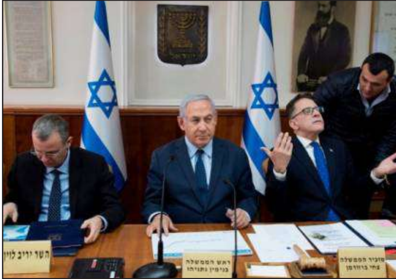
وأشار إلى أن «التحدي الأمني الثاني يتمثل بقطاع غزة، لأن الأيام المائة لحكومة نتياهو الحالية، شهدت إطلاق عشرات الصواريخ، ولم ترد على جزء كبير منها على الإطلاق، فيما جاء التحدي الأمني الثالث في العمليات المسلحة بالضفة الغربية وداخل الأراضي المحتلة عام 1948، حيث سجلت الأيام المائة الأولى

وأكد أن «التحدي الأمني الرابع يكمن في إيران، فقد أثبتت الأيام المائة الأولى من حكومة نتياهو، أن دولة الاحتلال تعاني من تآكل مكانة إسرائيل في مواجهتها، ولعل اتفاق السعودية وإيران بقيادة الصين مثال واضح على ذلك، مما يسهم في تصدع عزلة إيران بعد توريدها للأسلحة لروسيا».