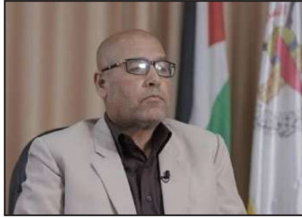
وشعبية وفصائل مقاومة وكان وجوده مهما ومميزاً. كما بين أن محور المقاومة شكل طليعة الأمة

لدعم القضية الفلسطينية ونحن بحاجة لتوسيع محور المقاومة والتفاف كل الأمة نحو فلسطين، مشدداً على أن الداعمين لقضية فلسطين أينما وجدوا، وجدت حركة الجهاد الإسلامي. وبشأن شعار «وحدة الساحات» أكد عضو المكتب السياسي للجهاد أن هذا الشعار بات واقعا. وهو مبدأ في أبجديات حركة الجهاد الإسلامي، وترسخ في معركة وحدة الساحات التي خاضتها سرايا القدس، مضيفا أن شعار وحدة الساحات اليوم يتحدث به كل القادة في فلسطين وخارجها في وقت كان البعض غير مقتنع