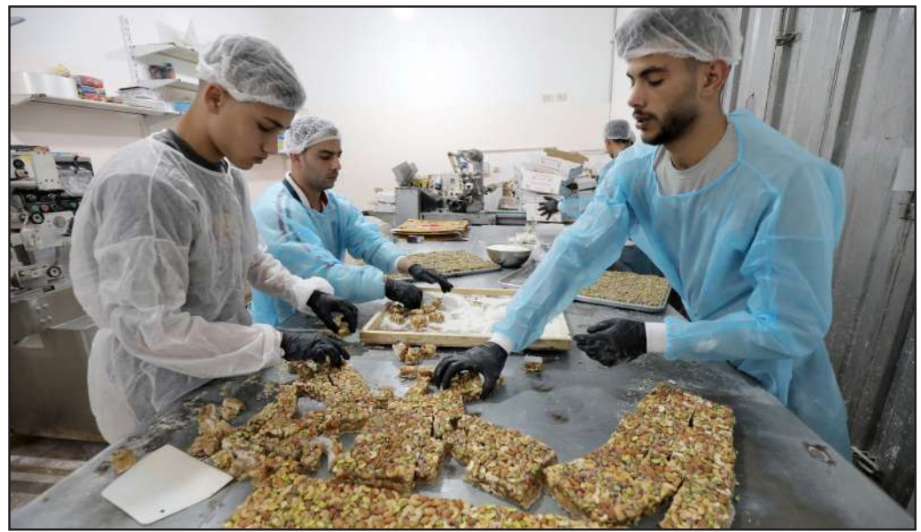
فلسطينيون بجهزون حلويات الحلقوم في أحد مصانع قطاع غزة استعداداً لعيد الفطر السعيد

أوضحت دراسة جديدة أن أدمغتنا تعمل بطاقات هائلة، وتكون أكثر فاعلية حين نواجه الروبوتات في ألعاب رياضية. وحسب تقرير منشور في موقع روسيا اليوم خُصص باحثون إلى هذه النتيجة، وهم من جامعة فلوريدا، بعد تحليل عشرات الساعات من مباريات تنس الطاولة، كان البشر خلالها يواجهون الآلات، وكذا بعضهم بعضاً. وقد ارتدى اللاعبون أغطية أقطاب كهربائية حتى يمكن مراقبة نشاط دماغهم أثناء الألعاب، ووجد العلماء أن أدمغة اللاعبين تعمل في انسجام تام، عند اللعب بعضهم ضد البعض الآخر، «كما لو كانوا جميعاً يتحدثون اللغة نفسها». ولكن عندما واجه اللاعبون آلة إرسال الكرة لم تكن الخلايا العصبية في أدمغتهم متراصة بالطريقة نفسها، وقال الباحثون إن معلم، الذي نُشر في مجلة eNeuro يظهر أن الدماغ يعمل بجهد أكبر عند اللعب ضد الروبوتات.