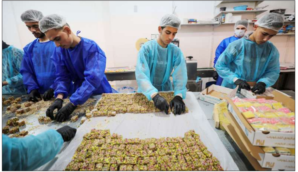
تجهيز حلوى الحلجوم داخل أحد المصانع في مدينة غزة

وبدأت فلاميني مغامرتها يوم السبت 20 نوفمبر 2021، وخرجت إلى النور، الجمعة الماضية، بجنوب إسبانيا، وكانت تضع نظارة داكنة وتحمل معداتها وتبتسم ابتسامة عريضة، وقالت في تصريحات بعد ذلك بقليل: إن تجربتها كانت «ممتازة ولا يضاهيها شيء»، وأضافت «عندما دخلوا لإخراجي كنت نائمة، ظننت أن أمراً ما قد حدث وقلت: بهذه السرعة؟! لم أنته من قراءة كتابي بعد، ورداً على سؤال عما إذا كانت قد فكرت في الخروج من الكهف قالت: «لم يحدث ذلك قط، لم أرغب في الخروج في حقيقة الأمر».