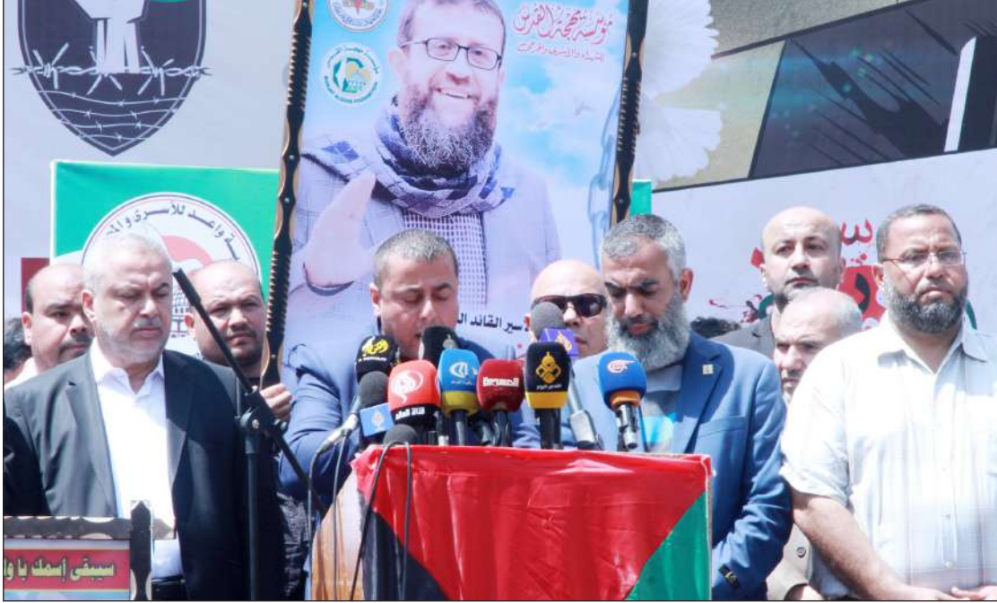
وقفة تضامنية مع الأسرى بمدينة غزة أمس