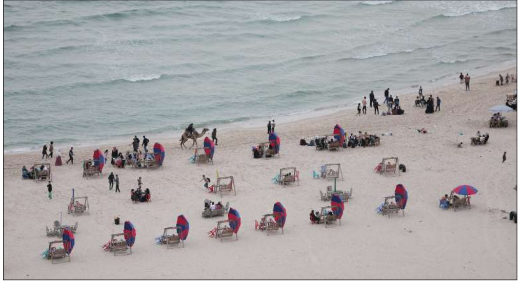
شاطئ بحر مدينة غزة

وأضاف: «من معي في الصور هم أبنائي وأبناء شقيقاتي». ونشر الشواهين صورة طريفة وهو يوزع العيديات على أبنائه بالقول: «الذكرى الخامسة لاستخدام الحرير السري للعيديات، لمنع تكرارها وتحقيقاً للشفافية».