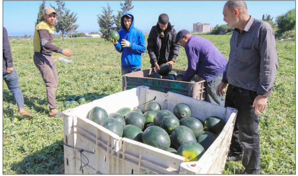
مزارعون يقطفون البطيخ في بداية موسمهم في خان يونس جنوب قطاع غزة

تستمر إيطاليا في فرض المزيد من القيود على السائحين في عدد من أبرز المواقع السياحية بها، للحد من ظاهرة التكديس والازدحام. وتتبع إيطاليا أسلوب الغرامات، وفرض الرسوم الإضافية على زوار أكثر مواقعها السياحية ازدحاماً. للحد من ظاهرة تكديس السياح، وكانت أحدث وجهة سياحية تطبق عليها هذه النظرية، هي مدينة «بورتوفينو» الساحلية الشهيرة. وتقول مجلة «تايم أوت»، إن أحدث القرارات الإيطالية للحد من ازدحام السياح، تطبيقها لقانون جديد، تمنع من خلاله تكاسل السياح عن الحركة في المواقع السياحية التي تعرف بالإقبال عليها، في مدينة بورتوفينو للحد من ظاهرة التكديس. والقانون، الذي أطلق عليه قانون حظر الانتظار، سيعاقب السياح الذين يمكنهم في مناطق محددة من المدينة، يعرف عنها إقبال السياح عليها، لمدة أطول من اللازم، وهذه المدينة السياحية، سيفرض بها على السياح المتكئين في المواقع السياحية البارزة لأسباب منها التقاط الصور، غرامة تقدر بـ300 دولار للتباطؤ عن الحركة. الأماكن التي سيطبق بها قانون حظر الانتظار، هي أكثر الأماكن التي لوحظ بها تجمع السياح دائماً، للتقاط الصور التذكارية خلال زيارتهم لمدينة بورتوفينو الساحلية في إيطاليا. وقال عمدة مدينة «بورتوفينو» ماتيو فيكافا، إن هذا القرار سيقفل من المظاهر السلبية، مثل التكديس المروري في أنحاء المدينة، وانسداد منافذ العبور للقادمين من الشوارع المختلفة.