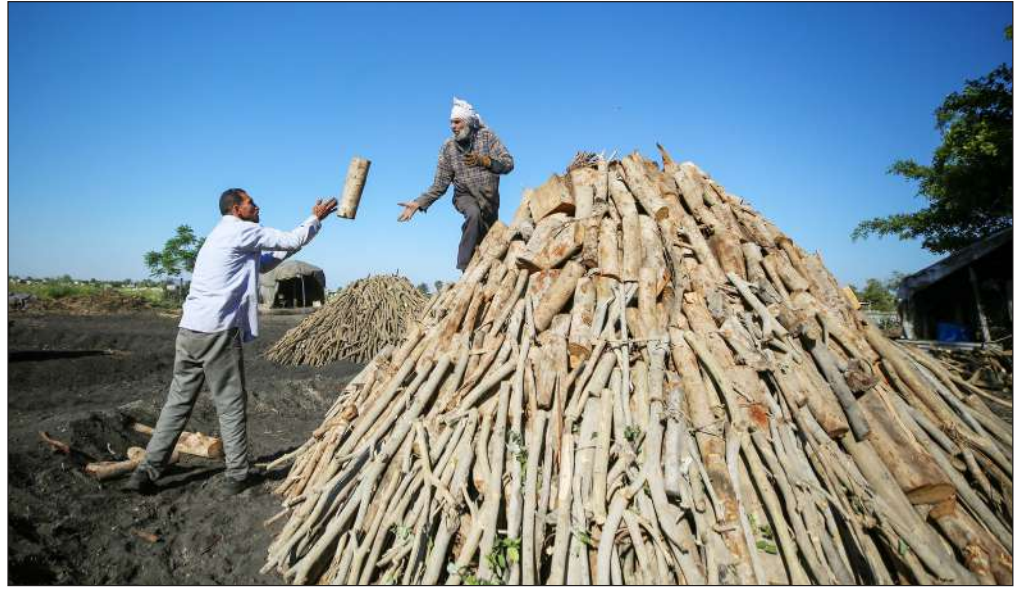
عمال يجمعون الأخشاب شرق مدينة غزة

ولخصت الورقة البحثية إلى أن تطوير روبوتات تكون في مراتب وظيفية أعلى من البشر سيؤدي إلى تفاقم العداء بين الآلة والإنسان، وهذا أمر يتطلب تدخلا وفهما عميقا لطبيعة المشاعر التي يولدها وجود الروبوت في حياتنا.