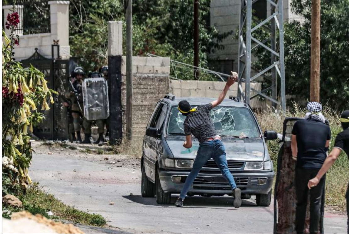
المواجهات بين الشبان وقوات الاحتلال في قرية كضر قدوم قرب قلقيلية أمس

الضفة المحتلة/ الاستقلال: واصلت قوات الاحتلال الإسرائيلي والمستوطنون، الجمعة، عدوانهم على شعبنا ومقدساته وممتلكاته، حيث أصيب عدة مواطنين خلال