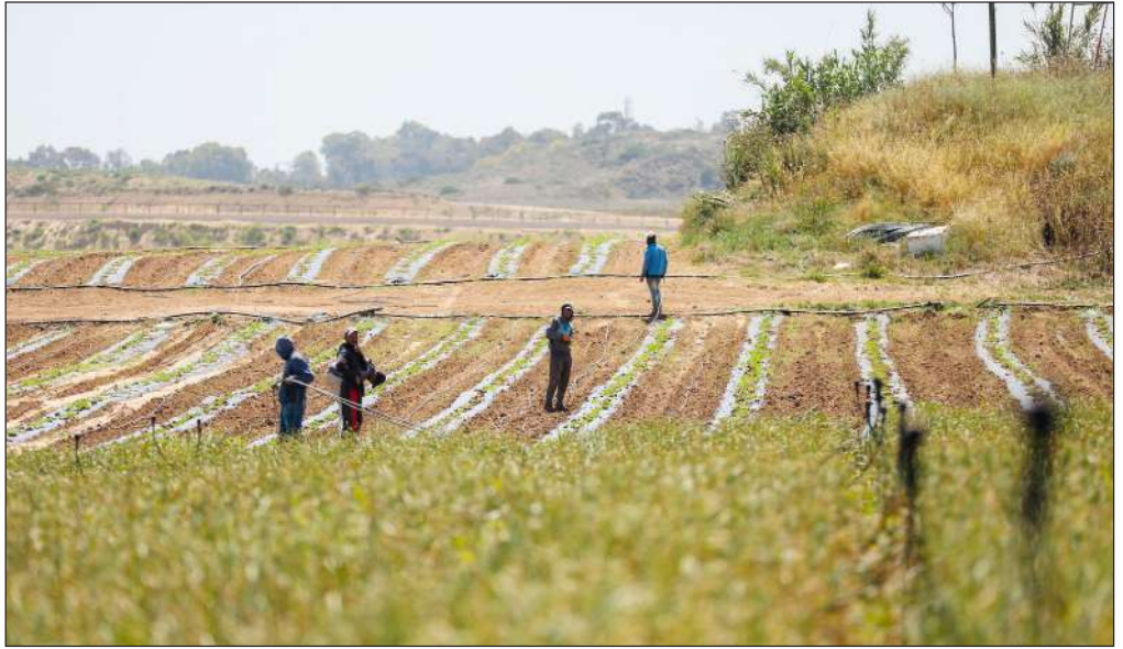
مزارعون يعملون داخل أحد الأراضي الزراعية في مدينة غزة