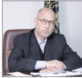
وتقديم التضحيات"، مشدداً على أن هذه الرسالة يطبقها الجيل الناصر الآن على أرض الواقع. ثقافة المقاومة وذكر عضو المكتب السياسي بالجهاد،

صلبة خاصة وأن المقاومة الفلسطينية حققت تقدماً بالنقاط على الاحتلال على مدار عشرات السنوات وأخرها معركة «ثار الأحرار». وقال د. القطبي في حديث خاص مع «الاستقلال»، الثلاثاء، إن شعبنا لم يكف يوماً عن مقاومة الاحتلال والإصرار على العودة، وأصبح بعد معركة «ثار الأحرار»، وجه آخر للنكبة الفلسطينية هو وجه المقاومة والتحرير، وأن هذا التطور عزز آمال شعبنا بقرب ساعة التحرير والخلص من الاحتلال.