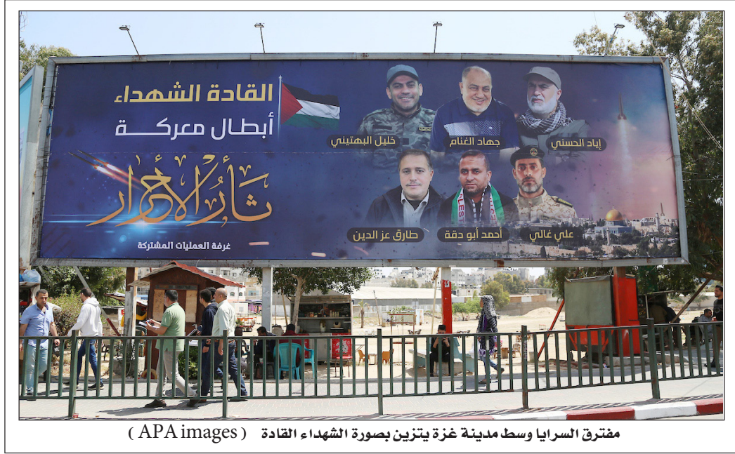
مفترق السرايا وسط مدينة غزة يتزين بصورة الشهداء القادة

طور فريق باحثين بجامعة أوبسالا السويدية وسيلة علاج جديدة لاستخدام الخلايا المناعية في الجسم للقضاء على الأورام السرطانية في المخ. ويعتبر الورم الأرومي الدبقي متعدد الأشكال من أخطر الأورام التي تصيب مخ الإنسان، خاصة بسبب قدرته على تعطيل رد الفعل المناعي الطبيعي للجسم على الأورام. وتهدف وسائل العلاج المناعي التقليدية إلى تنشيط رد الفعل المناعي ضد الأورام بخلايا مناعية معينة باسم الخلايا «تي». غير أن الأوعية الدموية داخل الورم السرطاني تعطل وصول الخلايا تي إلى الورم للقضاء عليه. وحسب الدراسة التي أوردتها الدورية العلمية Cancer Cell، استطاع الفريق تطوير وسيلة لمساعدة الخلايا تي للوصول إلى الورم والتعامل مع الخلايا السرطانية. وتعتمد فكرة البحث على استخدام ناقل فيروسي لإصابة الأوعية الدموية داخل الورم، ما يزيد إمكانية وصول الخلايا المناعية تي إلى أنسجة الورم. ونقل موقع «ميديكال إكسبريس» عن الباحثة آنا ديمبرغ «وجدنا أن الأوعية الدموية في الورم السرطاني تتغير شكلها ووظيفتها عند استهدافها بالناقل الفيروسي»، مضيفاً أن الناقل استحدث تفاعلاً داخل الأوعية ساعد في وصول الخلايا تي إلى الورم السرطاني. ويدرس الباحثون تطويع هذه الطريقة لعلاج المصابين بأنواع أخرى من الأورام الأرومية الدبقية.