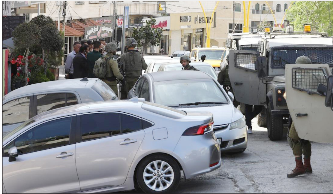
اقتحام قوات الاحتلال لمدينة الخليل أمس

الضفة الغربية والقدس المحتلة/ الاستقلال: أصيب عدد من المواطنين بالرصاص الحي والاختناق أمس الثلاثاء، خلال اقتحامات ومواجهات عدة مع قوات الاحتلال الإسرائيلي