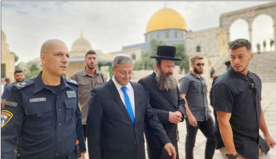
اقتحام بن غفير لباحات المسجد الأقصى المبارك