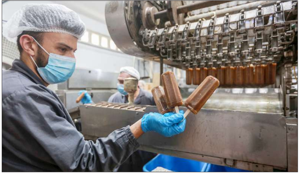
تجهيز الآيس كريم داخل أحد المصانع في مدينة غزة

كاد قلم سحري أن يتسبب في رسوب طالبة بكلية الطب في سوريا. وفي التفاصيل فقد اعترضت طالبة سورية من كلية طب الأسنان بجامعة «الشام»، على نتيجتها في إحدى المواد، حيث أخذت درجة الصفر. وأكدت الطالبة لصحيفة «تشرين» المحلية، أنها أجابت عن كل الأسئلة بشكل صحيح، ولا توجد بحقها أي عقوبة أو إنذار امتحاني يستدعي هذه النتيجة. اعترضت الطالبة دفع رئيس الجامعة الدكتور شريف الأشقر، تحزير ورقتها الامتحانية، ليتبين أنها بيضاء ناصعة سوى من أسئلة المادة، وعند عرضها على الطالبة أصابها الذهول. وبالعودة إلى كاميرات المراقبة بالقاعة، تبين أن الطالبة كانت تكتب وتجييب، الأمر الذي أثار استغراب المسؤولين عن متابعة الأمر. وبحسب الصحيفة، سألتها رئيس الجامعة عن القلم الذي كتبت به، فتوضّح له بأنه قلم عادي، وعند التدقيق به، لفت نظره ملاحظة مكتوبة باللغة الإنجليزية (بعدم استخدام القلم للأوراق الرسمية والعقود)، وبأن حبره يختمي ويعود إذا وضع في براد درجة حرارته تحت -10. ووضعت الورقة في براد الجامعة، بانتظار عودة الكتابة والتي بدأت بالظهور تدريجياً لتتم إعادة تصحيحها من جديد.