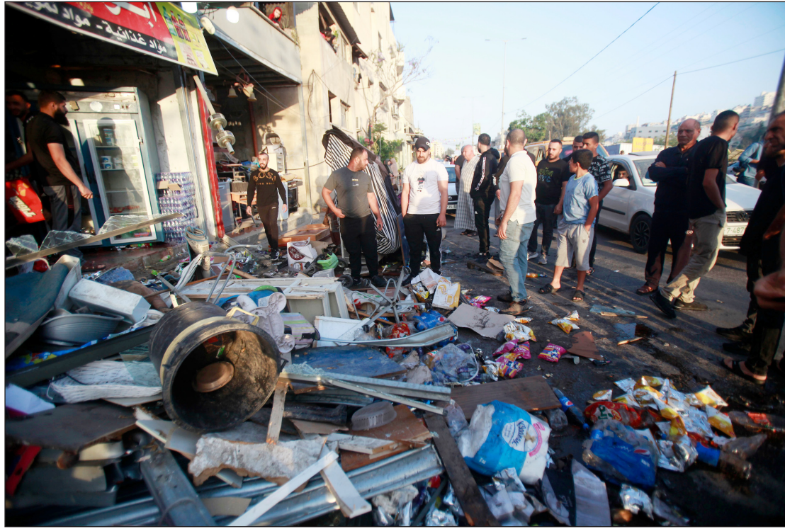
آثار الدمار الذي خلفه الاحتلال عقب اقتحام مخيم نور شمس في طولكرم أمس

قتل مستوطن "إسرائيلي"، ظهر الثلاثاء، متأثراً بجراحه الخطيرة جراء تعرضه لعملية إطلاق نار قرب إحدى المستوطنات شمالي طولكرم شمالي