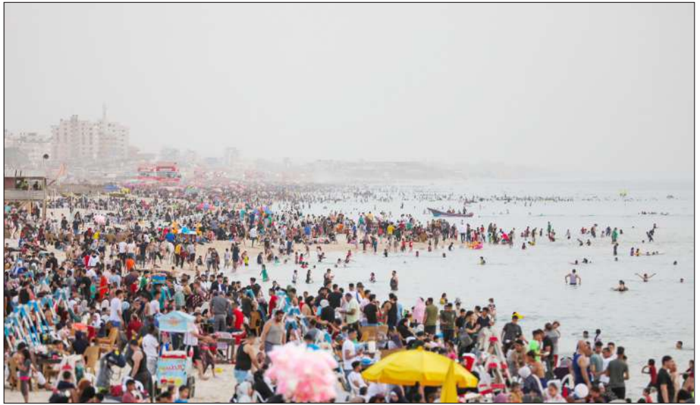
مواطنون يصفطون على شاطئ بحر مدينة غزة أمس

وكان اللصوص قد استأجروا فندقاً بالقرب من هدفهم بحجة رغبتهم في الاستحواذ عليه، وأمضوا معظم أيام إقامتهم في الحفر باستخدام أدوات بدائية لتجنب جذب الانتباه. وقام اللصوص بمسح الفندق لفترة طويلة قبل التواصل مع المالك وجعله يعتقد أنهم يريدون استثمار الفندق، وقاموا بتأجيرها بسعر شهري 4,5 مليون وون (3500 دولار)، وأغلقوا المبنى على الفور وبدأوا الحفر في الطابق السفلي من المبنى، واستخدموا المجارف والمؤوس فقط للحفاظ على مستويات الضوء منخفضة، لكن في النهاية اقتربوا من هدفهم.