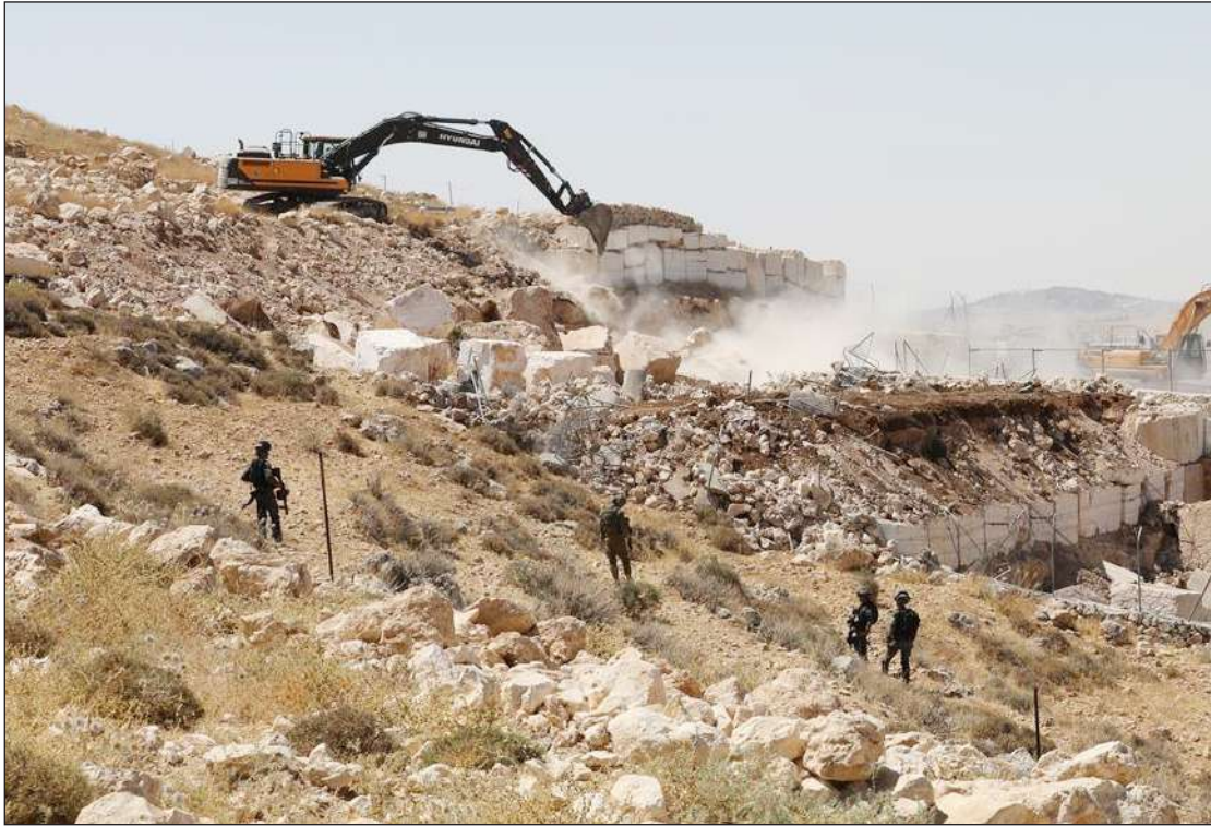
قوات الاحتلال تجرف أراضي في قرية بيرين جنوب الخليل أمس

الضفة الغربية- القدس المحتلة/الاستقلال: جرفت قوات الاحتلال الإسرائيلي، أمس الثلاثاء، أراضي زراعية في قرية بيرين جنوب الخليل، في الوقت الذي اقتحم عشرات المستوطنين، البلدة