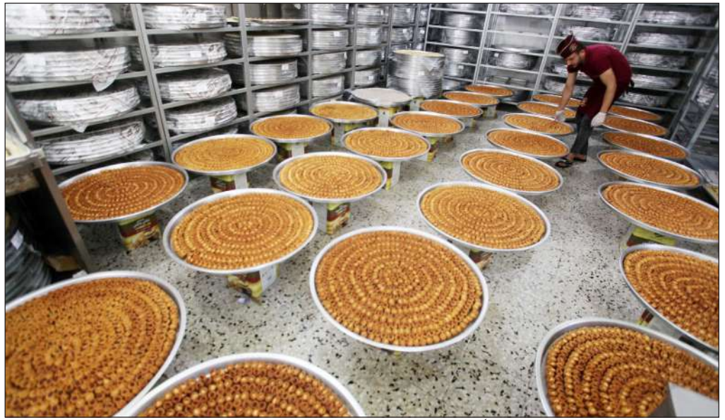
تجهيز الحلويات استعداداً لإعلان نتائج الثانوية العامة في مدينة غزة

وتعتبر التوجيهات السابقة أن الحدود الصحية لنسبة الدهون في مدخل الطاقة اليومي 35% من السعرات، ومن الدهون المشبعة 15%، وهو ما تم تقييده إلى 30% و10% على التوالي.