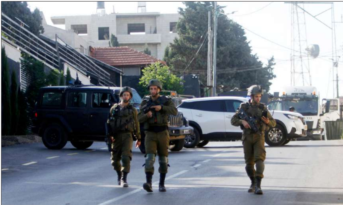
انتشار قوات الاحتلال في مكان إعدام الشهداء في مدينة نابلس أمس

الضفة الغربية/ الاستقلال: أدمت قوات الاحتلال الإسرائيلي، صباح أمس الثلاثاء، ثلاثة شبّان بالرصاص داخل سيارتهم قرب منطقة الطور جنوب نابلس شمالي الضفة الغربية، وذلك عقب تنفيذهم عملية إطلاق نار ضد قوات الاحتلال في المنطقة، في الوقت ذاته، أصيب عدد من المواطنين بحالات اختناق خلال مواجهات اندلعت مع قوات الاحتلال في مناطق متفرقة من الضفة المحتلة، فيما أجبرت قوات الاحتلال مواطناً مقدسيا على هدم منزله ذاتياً في بيت حنينا بمدينة القدس المحتلة. واستشهد، صباح أمس الثلاثاء، 11