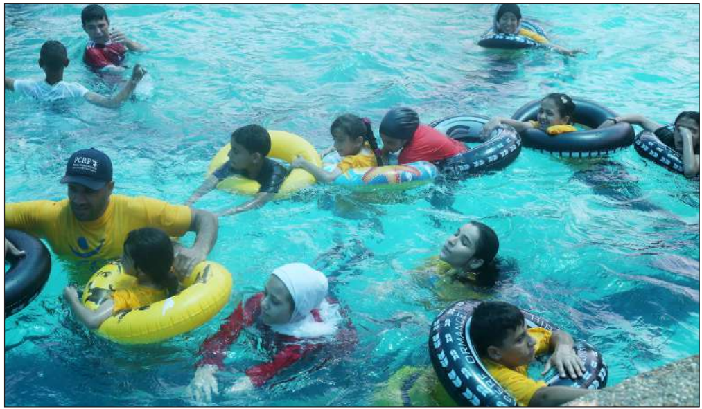
أطفال بترت أطرافهم يلعبون في حوض سباحة في مدينة خانيونس

وأشار التقرير إلى عدد حالات الغرق المسجلة في العام 2019 حيث تسبب في وفاة ما يقدر بنحو 236 ألف شخص، ما دفع بتسريع تصنيف الغرق بـ مشكلة صحية عامة في جميع أنحاء العالم. المثير للقلق أن الغرق هو من بين العشرة الأوائل لأسباب وفاة الأطفال والشباب في كل منطقة من مناطق العالم، ويزيد احتمال تعرض الذكور للغرق مرتين عن الإناث، فيما تقل أعمار أكثر من نصف الضحايا عن 25 عاماً.