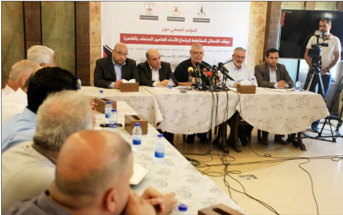
جانب من المؤتمر الصحفي للفصائل المقاطعة للقاء القاهرة بمدينة غزة أمس

حمدونة لـ «الاستقلال»: إلغاء الإفراج المبكر عن الأسرى إمعان في هضم حقوقهم والانتقام منهم