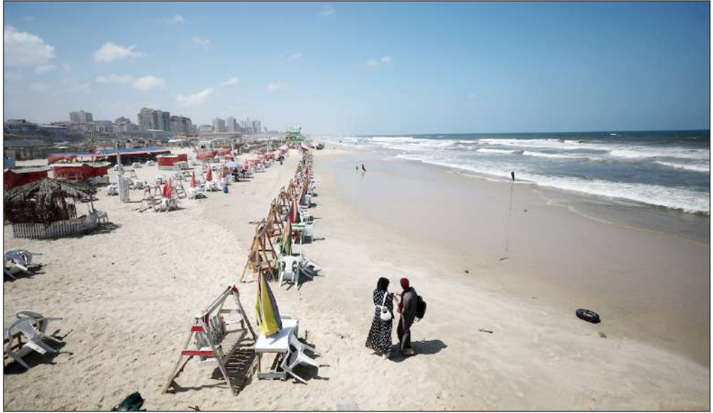
شاطئ بحر مدينة غزة

واعترف المشتبه به لأحد الأشخاص في محيطه بارتكابه جريمة قتل، وتشارك الأخير هذه المعلومات مع شخص آخر كان من أخطر الشرطة بها.