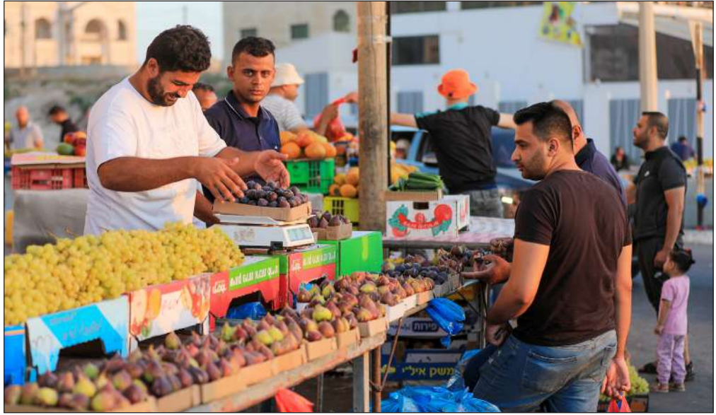
بيع التين والعنب في أحد شوارع مدينة غزة

وكانت تقارير قد انتشرت في العراق، تفيد بانتشار دواء هندي لعلاج حالات البرد لدى الأطفال «ملوث بمواد كيميائية سامة»، تسمى «غلايكول الإثيلين»، كانت قد أدت لحالات وفاة جماعية لأطفال العام الماضي في غامبيا وأوزبكستان.