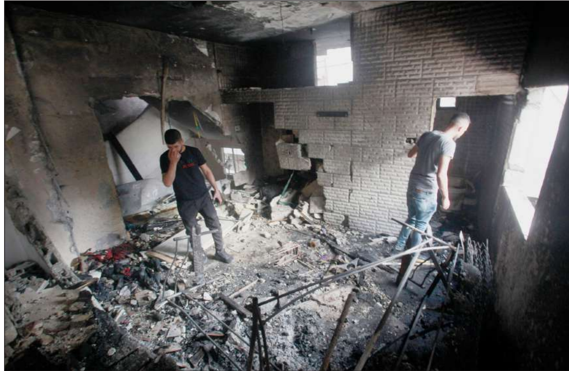
مواطنون يتفقدون آثار الدمار الذي لحق بمنزلهم في مخيم بلاطة بمدينة نابلس

القدس المحتلة- الضفة الغربية/الاستقلال: أصيب 94 مواطناً فلسطينياً، بينهم إصابة خطيرة، برصاص وغاز جيش الاحتلال، يوم امس، خلال اقتحام قوات الاحتلال الصهيوني شرق