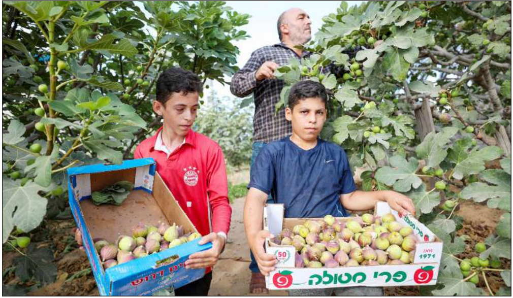
جني ثمار التين في مدينة غزة

ورغم أنها دفعت الفاتورة دون اعتراض، إلا أنها نشرت لاحقاً مراجعة سلبية للمطعم بحجة أنها لم تطلب قط قطع الشطيرة إلى النصف.