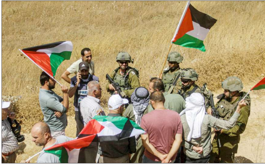
قوات الاحتلال تقمع المسيرة الاحتجاجية ضد الاستيطان في بيت دجن شرق نابلس أمس