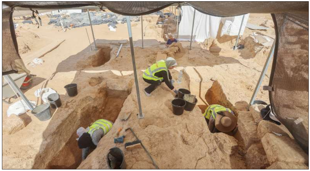
علماء آثار فرنسيون وفلسطينيون يعملون في المقبرة الرومانية غرب مدينة غزة

وتشير البيانات الجديدة الصادرة عن وكالة كوبرنيكوس الأوروبية لمراقبة البيئة إلى أن التوقعات كانت صحيحة على الأرجح، وتراجعت تركيزات الأوزون فوق القارة القطبية الجنوبية إلى مستوى منخفض للغاية في أوائل يوليو.